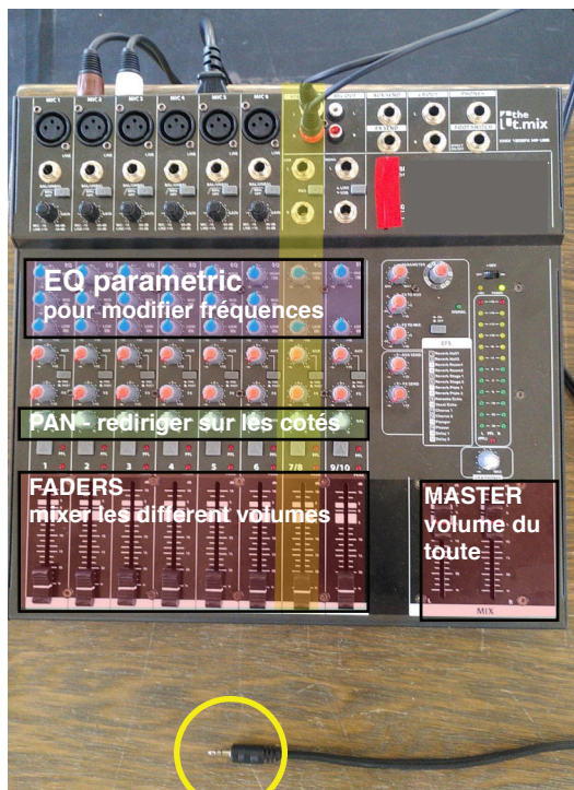
Table de mixage 12 canaux - Avec processeur d'effets intégré - 6 entrées micro XLR / entrées ligne - Alimentation fantôme 48V - Égaliseur 3 bandes et panoramique - 2 entrées stéréo - Sortie master via 2x XLR et 2x jack 6,3 mm - Sortie Control Room supplémentaire - Entrée et sortie enregistrement 2-Track via RCA (2 entrées / sorties) - Sortie casque contrôlable séparément - 1 sortie auxiliaire - Connexion pour pédale footswitch (pour enclencher / désenclencher les effets)